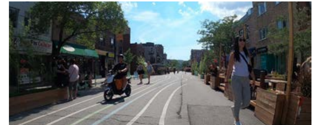
Présence d'usagers en scooter

Distinction de la sécurité réelle (étude réalisée par le LAPS, 2022)