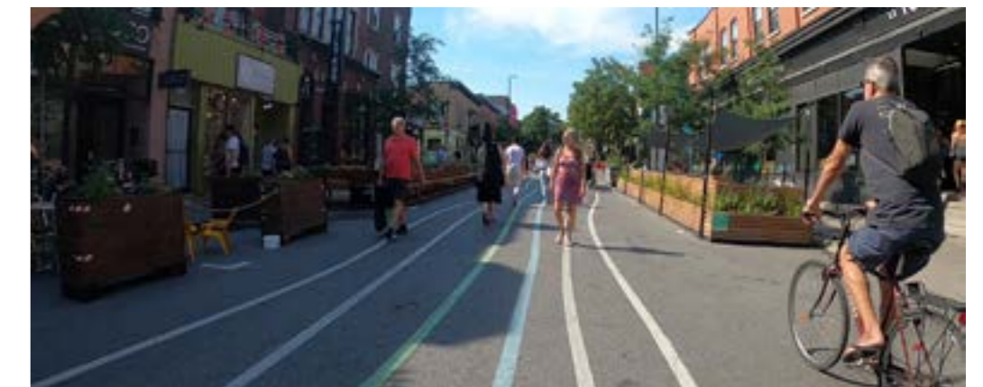
Partage de l'espace